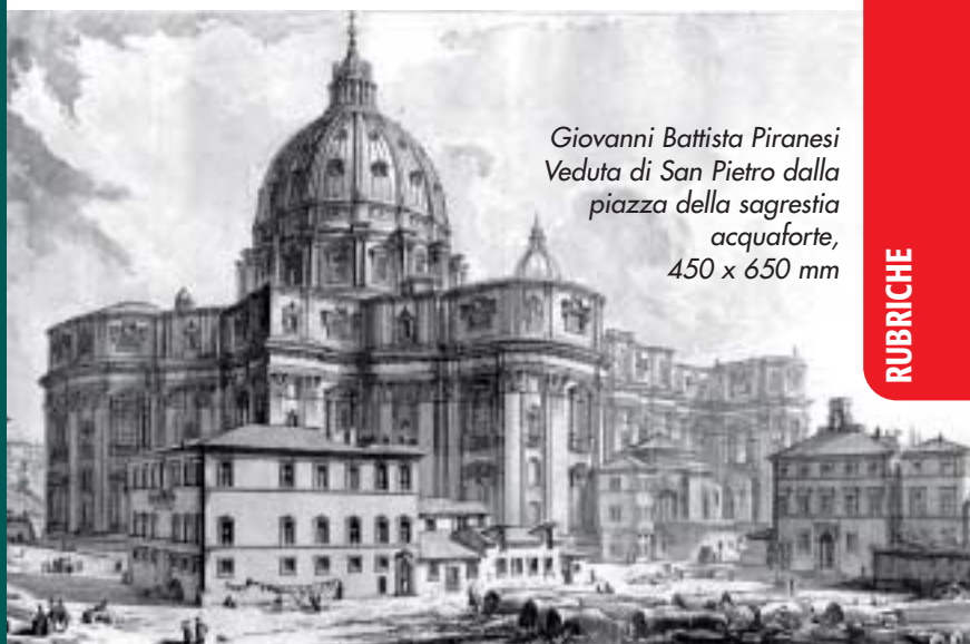
Giovanni Battista Piranesi Veduta di San Pietro dalla piazza della sagrestia acquaforte, 450 x 650 mm

Orari: Da lunedì a venerdì 10.00/12.00-14.30/19.00 Sabato, domenica e festivi 10.00/12.30-14.00/19.30