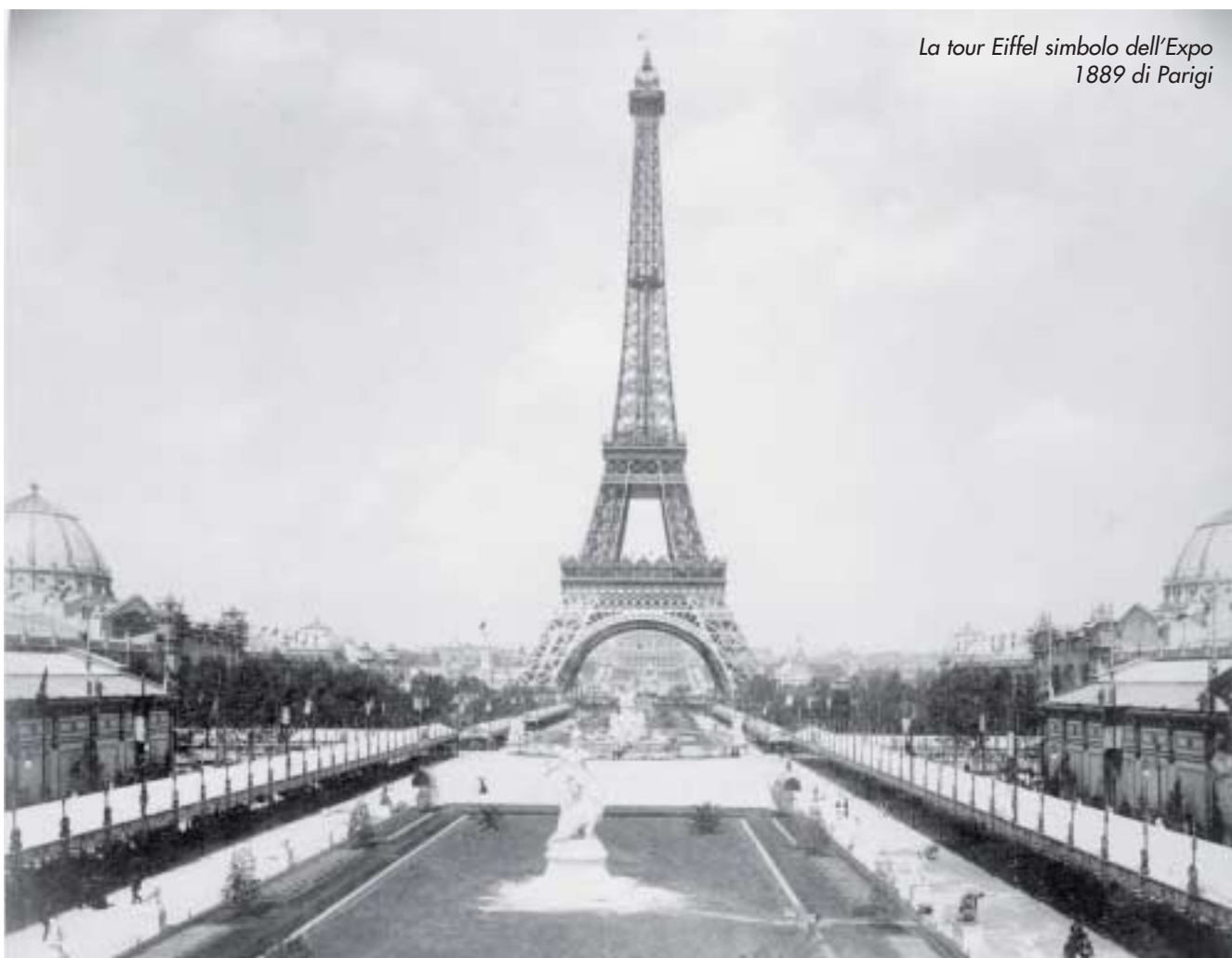
La tour Eiffel simbolo dell'Expo 1889 di Parigi