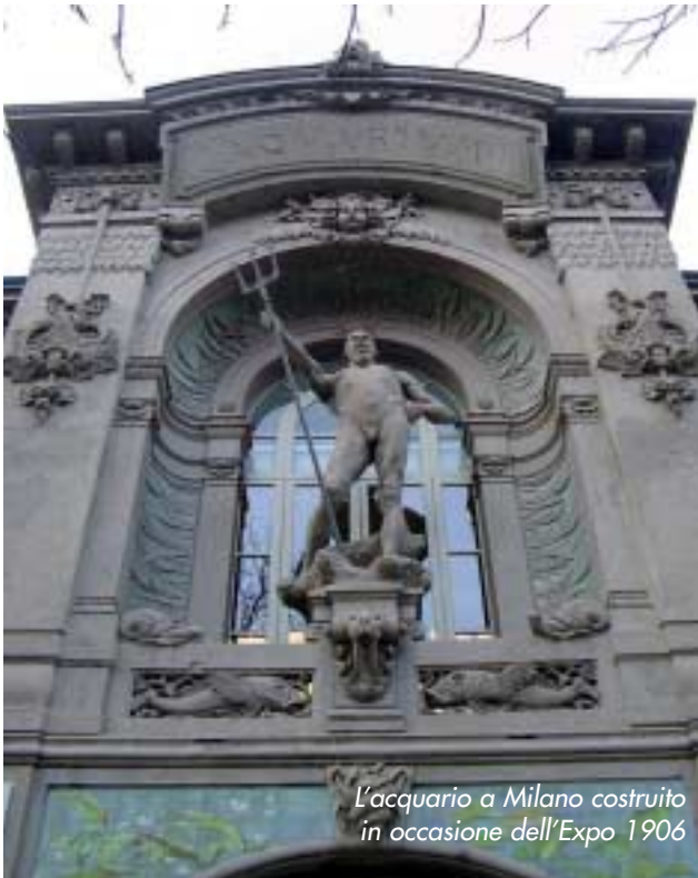
L'acquario a Milano costruito in occasione dell'Expo 1906

di supporto (il vecchio quartiere di Fieramilanocity è stato parzialmente demolito nel 2007/2008 per lasciare spazio al progetto di Citylife).